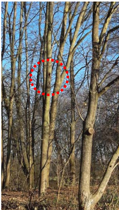
Abb. 12: Baum-Nr. 9, außerhalb des Untersuchungsgebietes