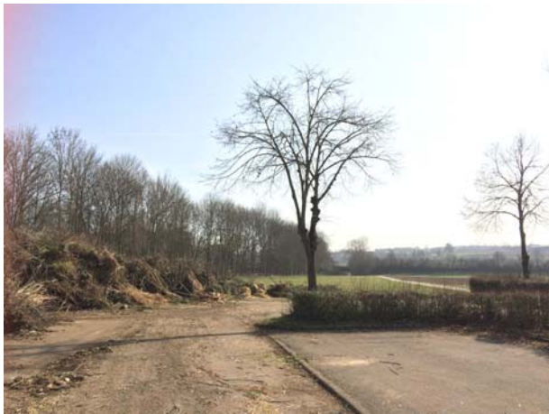
Abb. 8: Baum-Nr. 6