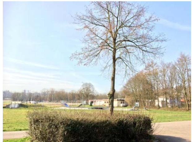
Abb. 9: Baum-Nr. 7