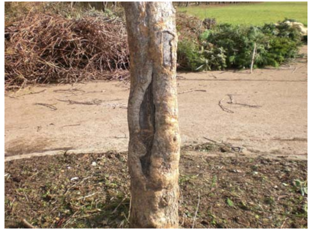
Abb. 11: Baum-Nr. 8 mit Stammschaden