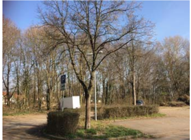
Abb. 3: Baum-Nr. 2