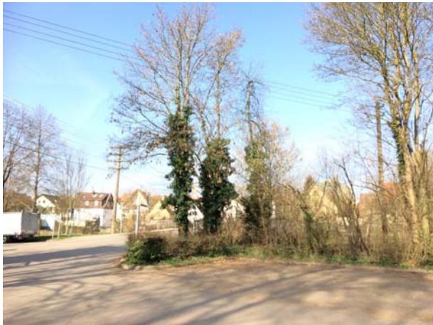
Abb. 2: Baum-Nr. 1