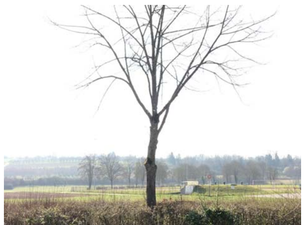
Abb. 7: Baum-Nr. 5