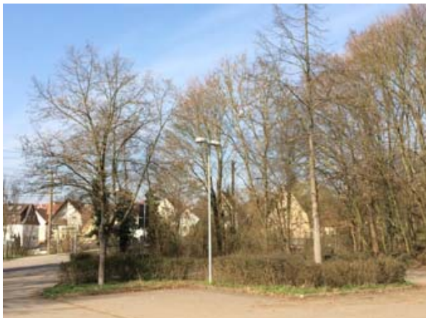
Abb. 4: Baum-Nr. 3 (rechts)