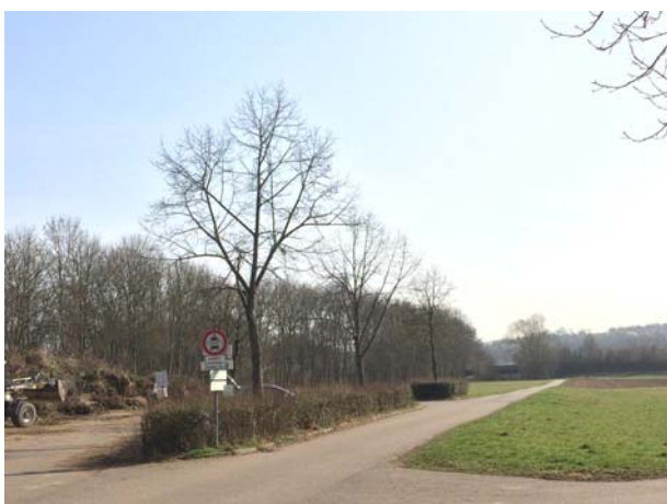
Abb. 6: Baum-Nr. 4