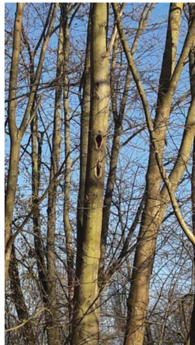
Abb. 13: Baum-Nr. 9, außerhalb des Untersuchungsgebietes