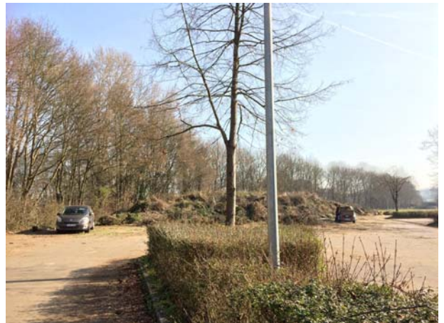
Abb. 5: Baum-Nr. 3