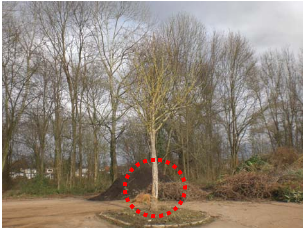
Abb. 10: Baum-Nr. 8