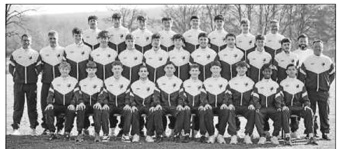
Die B-Jugend im neuen Look.