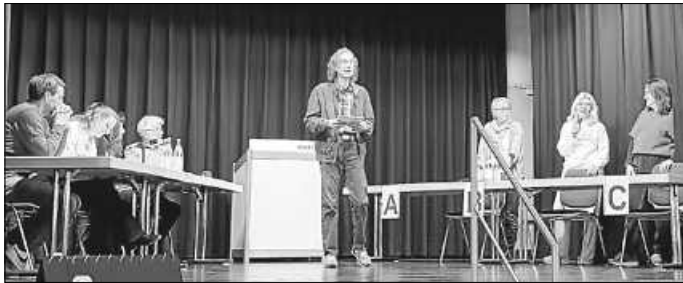
Bühne mit Kandidaten