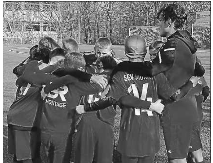
Die D2 machte es diesmal deutlich.