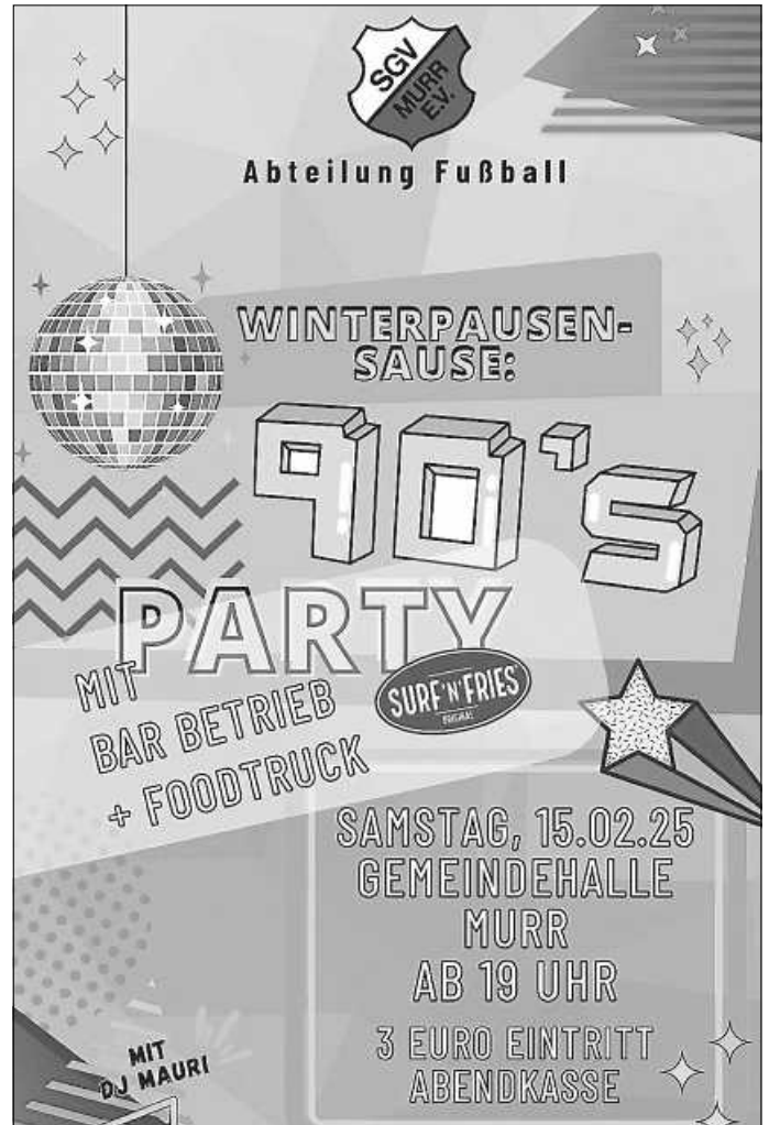
Am Samstag steigt die 90er-Party!

An diesem Samstag, 15. Februar, ist es so weit: In der Gemeindehalle am Lindenweg wird wieder gefeiert. Die Fußballabteilung des SGV Murr lädt ab 19 Uhr unter dem Motto „Winterpausen-Sause“ zu einer 90er-Party mit DJ, Bar und Food-Truck ein. Der Eintritt kostet drei Euro. Eintritt ab 18 Jahren. Wir freuen uns auf einen stimmungsvollen Abend!