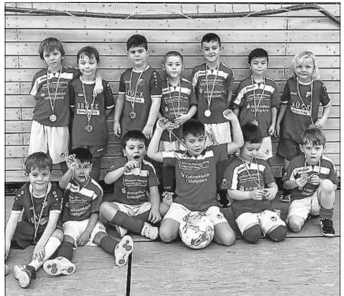
Die Bambinis stellten gleich 3 Teams.

Am Wochenende stand für die Mini-Teufelskicker ein besonderes Highlight auf dem Programm: Der Hallenspieltag beim TSV 1899 Benningen . Mit drei Teams waren wir vertreten – und alle zeigten großartige Leistungen! Von der ersten bis zur letzten Minute wurde mit vollem Einsatz gespielt, gepasst, gedribbelt und gejubelt. Unsere Teams begeisterten mit tollen Toren, schönen Kombinationen und vor allem mit viel Teamgeist. Die Kinder feuerten sich gegenseitig an, kämpften um jeden Ball und hatten dabei jede Menge Spaß. Besonders schön war die großartige Stimmung in der Halle – nicht nur auf dem Spielfeld, sondern auch bei den mitfiebersenden Eltern und Fans. Als krönenden Abschluss erhielten alle Kinder Medaillen als Erinnerung an diesen tollen Fußballtag. Die Mini-Teufelskicker freuen sich schon auf die nächsten Spiele!