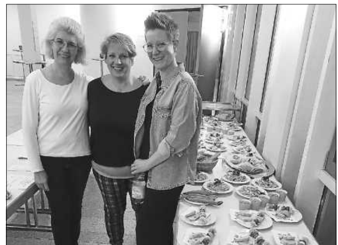
Drei von sieben fleißigen Helferlein.