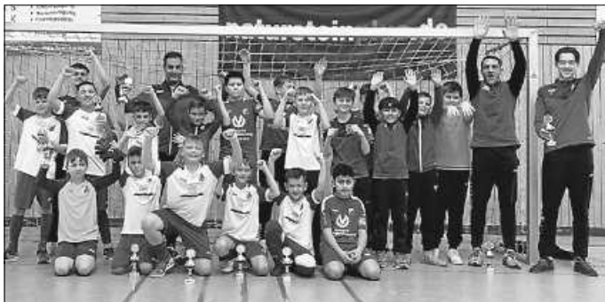
Die D-Jugend kann stolz auf sich sein.

Mit neun Minuten Spielzeit waren von Anfang an Tempo und volle Konzentration gefragt. Somit ging es für unsere Kicker im Turniermodus durch die Vorrunde. Als Gruppenzweiter traf man im Halbfinale auf die SpVgg Besigheim . Spannender hätte es kaum laufen können, da man sich nach der regulären Spielzeit 1:1 trennte. Somit musste das Neunmeterschießen entscheiden. Durch platzierte Torschüsse konnten unsere Jungs dieses für sich entscheiden. Dadurch stand man im Finale gegen den FC Marbach I , der sich im Halbfinale gegen Marbachs Zweite durchgesetzt hatte. In einem dramatischen Spiel vor dem Heimpublikum verlor man leider das Finale gegen die FC-Kicker. Zum Abschluss gab es einen Pokal und man war stolz, den zweiten Platz beim eigenen Hallenturnier belegt zu haben. Stolz sind ebenfalls die Trainer (Justin, Marius, Said und Sven) für den tollen Einsatz, den jeder Spieler an diesem Tag gezeigt hat. Auf diesem Wege möchten wir uns bei allen Eltern, Helfern und Kuchenspendern bedanken, die mit ihrem Beitrag zum tollen Erfolg des Turniers beigetragen haben.