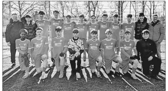
Die B-Jugend startet gut ins Jahr.