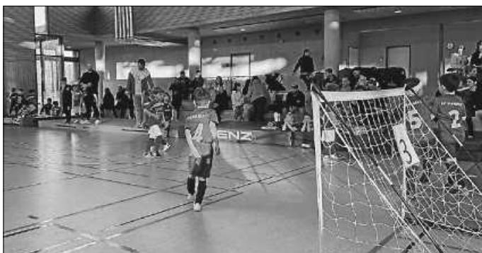
Und vor allem wurde viel gekickt!