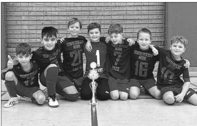
Der Trophäenschrank unserer E2 füllt sich.

Unsere Teufelskicker sind ein Team, das sich von Rückschlägen nicht entmutigen lässt. Die Jungs werden aus der Finalniederlage lernen und mit noch mehr Entschlossenheit in die kommenden Spiele gehen. Die nächsten Herausforderungen warten bereits – und eines ist sicher: Die Teufelskicker sind bereit!