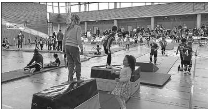
Es war viel Abwechslung geboten.

Die Fußballjugend – Abt. Fußball des SGV Murr