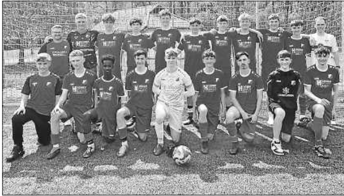
Die B-Jugend ist im Torrausch.