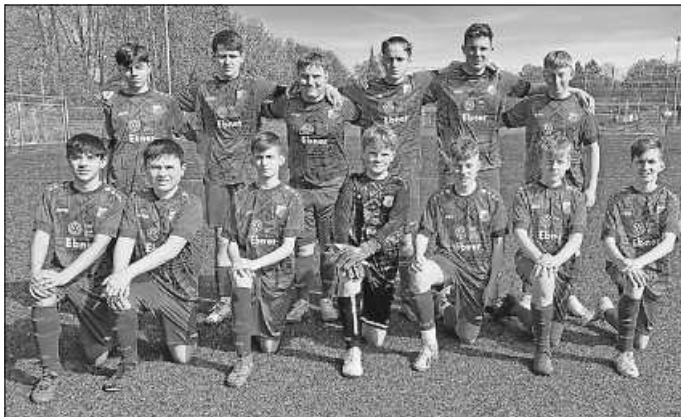
Die C2 erspielte sich viele Chancen.