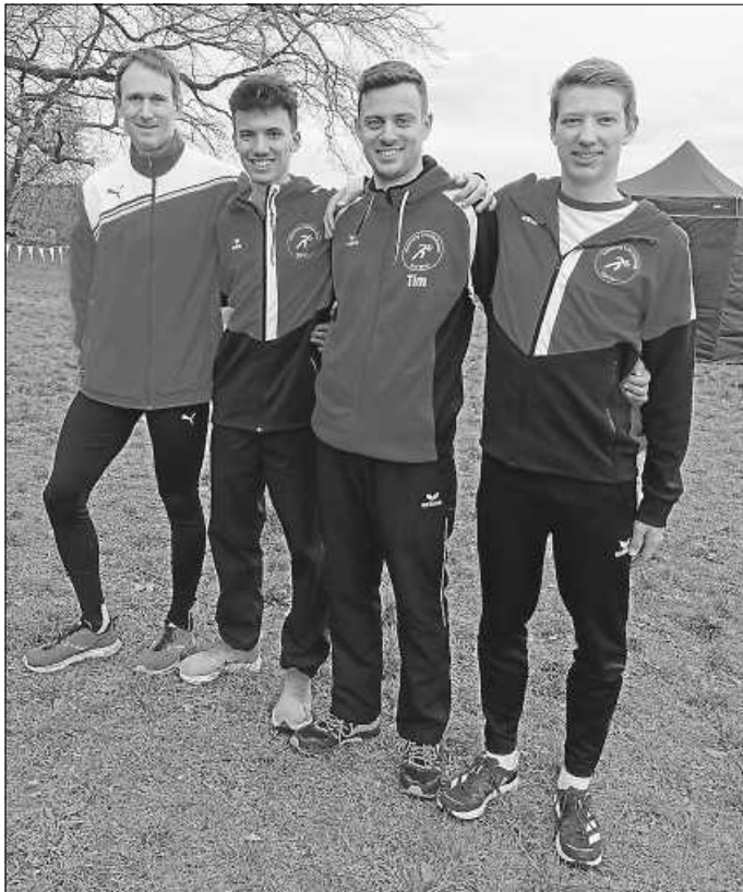
Athleten vom SGV Murr